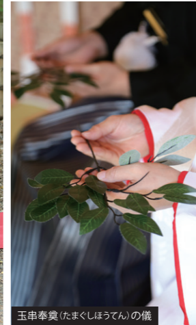
玉串奉奠(たまぐしほうてん)の儀