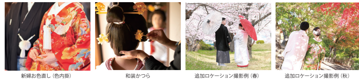
新婦お色直し(色内掛)