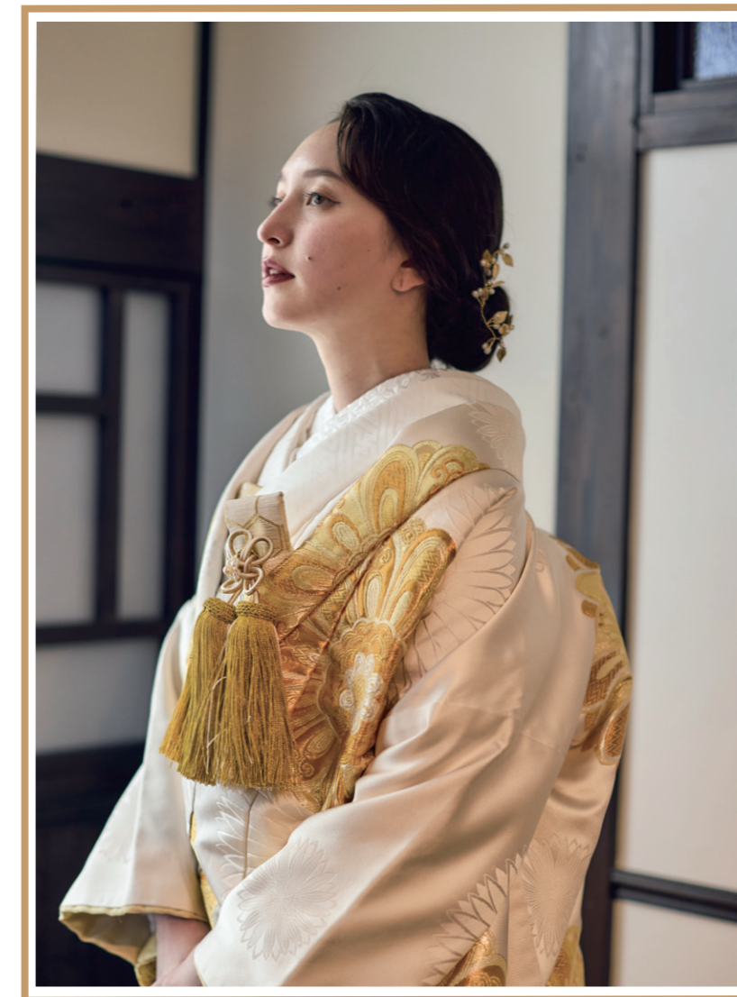
JAPAN STYLE WEDDING