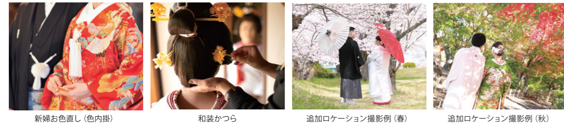
新婦お色直し(色内掛)