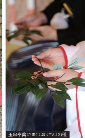
玉串奉奠(たまぐしほうてん)の儀