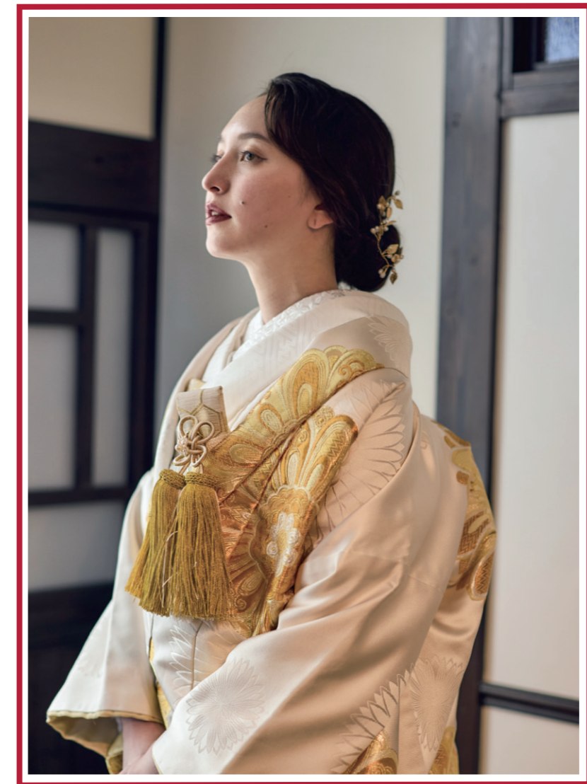
JAPAN STYLE WEDDING