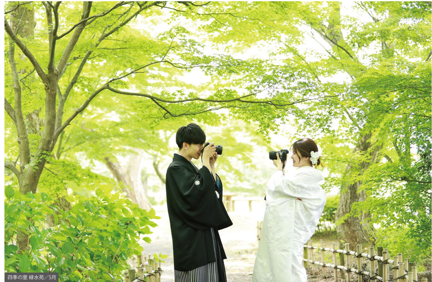
四季の里 緑水苑 / 5月