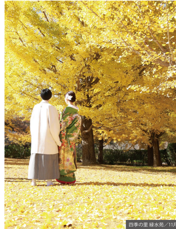
四季の里 緑水苑 / 11月

HappyVoice 撮影そのものが特別な思い出に 太陽の光を受けてキラキラと輝く紫陽花をバックに、まるでその瞬間の空気まで伝わってくるような印象的な写真になりました。 やわらかな光と季節の彩りに包まれて、ふたりにとって忘れられない一枚になりました。