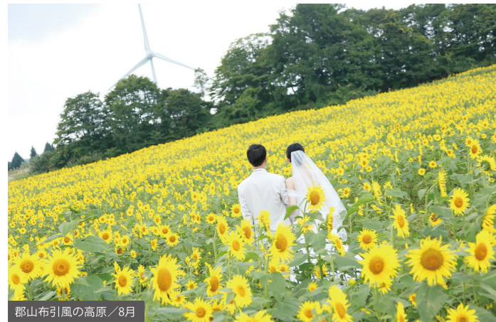
郡山布引風の高原 / 8月