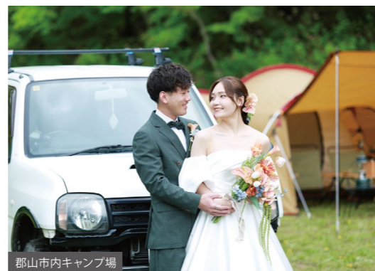
郡山市内キャンプ場

理想の1着で心に残るロケーションフォト 店内衣裳 どれでも OK ロケーションプラン 242,000yen 土日祝日プラス33,000yen