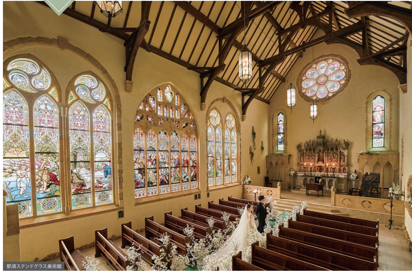
那須ステンドグラス美術館