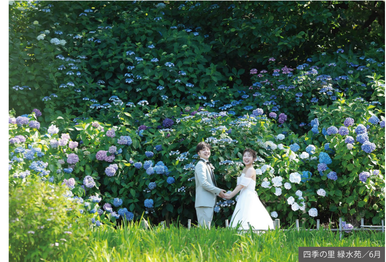
四季の里 緑水苑 / 6月

HappyVoice 撮影そのものが特別な思い出に 太陽の光を受けてキラキラと輝く紫陽花をバックに、まるでその瞬間の空気まで伝わってくるような印象的な写真になりました。 やわらかな光と季節の彩りに包まれて、ふたりにとって忘れられない一枚になりました。